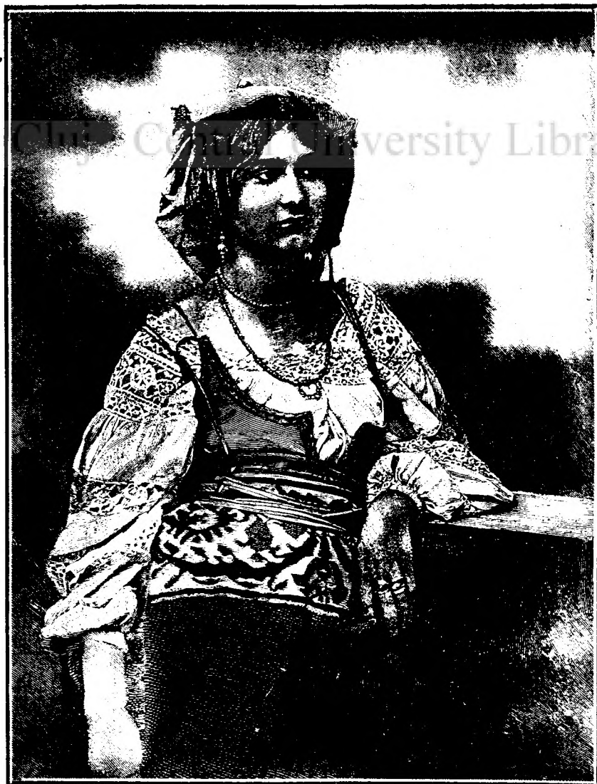
O CANTAREȚĂ ITALIANĂ.

Nevésta lui Nuțu, mai mult bolnavá decât sánetosá, se topiá pe picióre. Dar nu numai bóla o