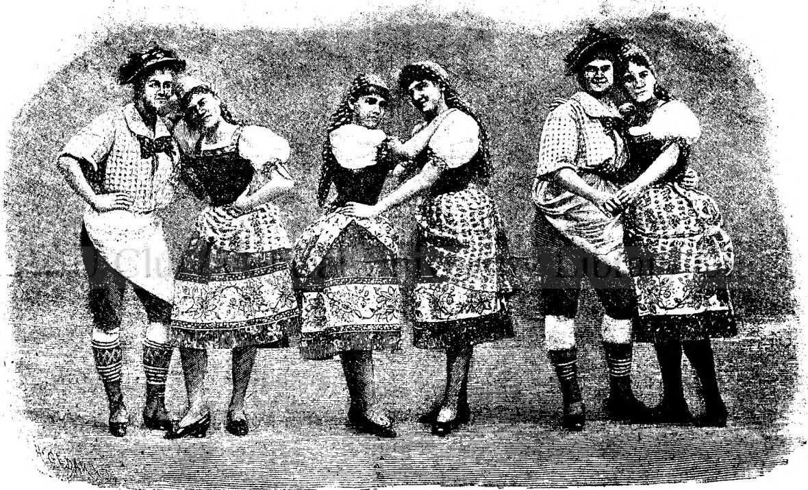
JOC POPORAL IN BRETAGNE.

Aceste m'au indemnat și pe mine ca să scriu ceva din astronomiá, đic ceva, și anume un extras din materiile cele mai ușóre, dar totuș ce forméză ceva in-treg, ca ficarele cu cultură cât de modestă, încă să pótá pricepe, séu cel puțin despre lucrurile dumneđuești să aibă o idee mai lámurită 1 .