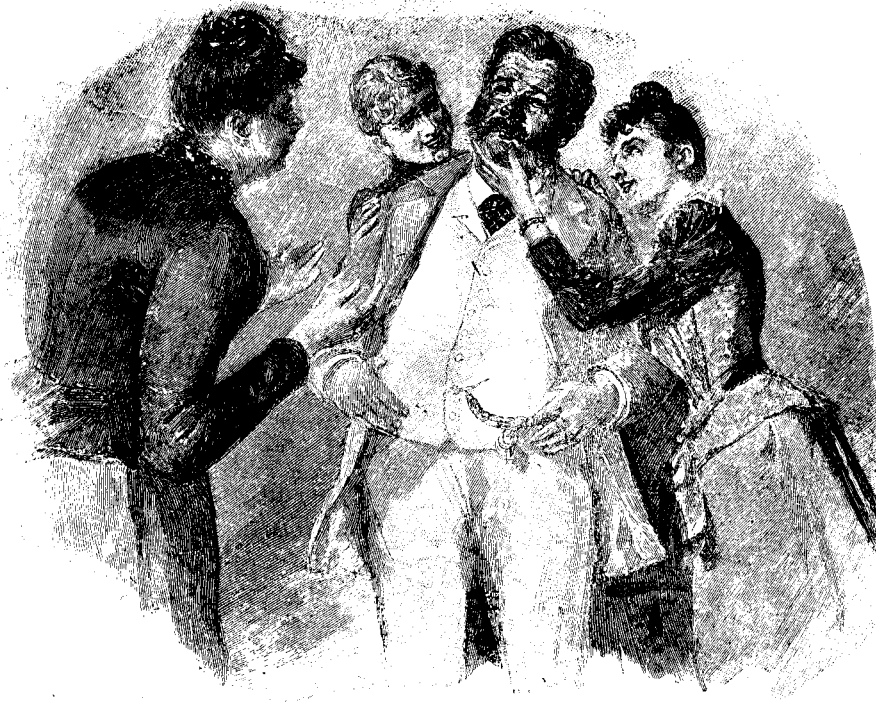
INAINTE DE BAL.