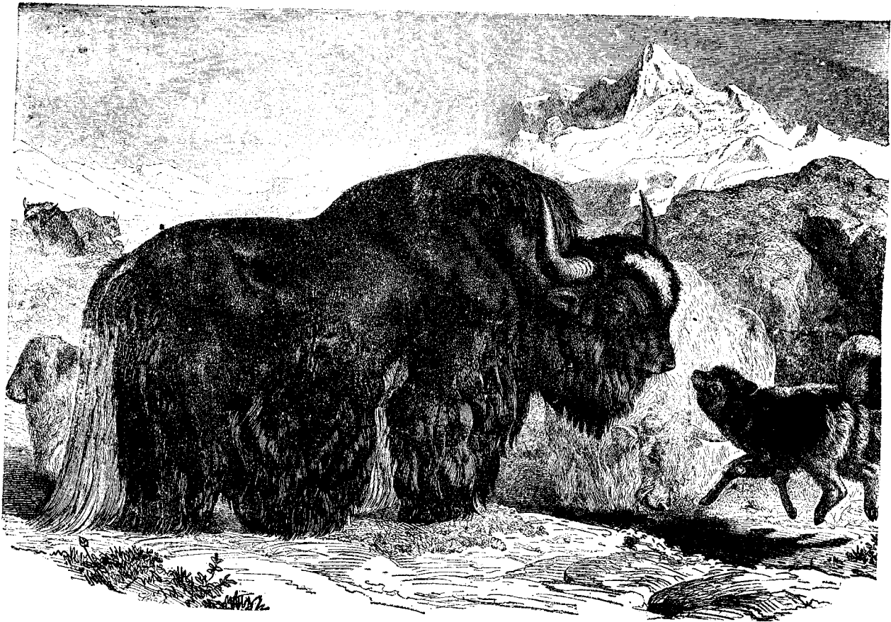
BIBOL SELBATIC DIN TIBET.

Femeia îi respunse că, in tótá casa lui nu a găsit nimic altă-ceva care să-i fie mai drag decát el, și l'a