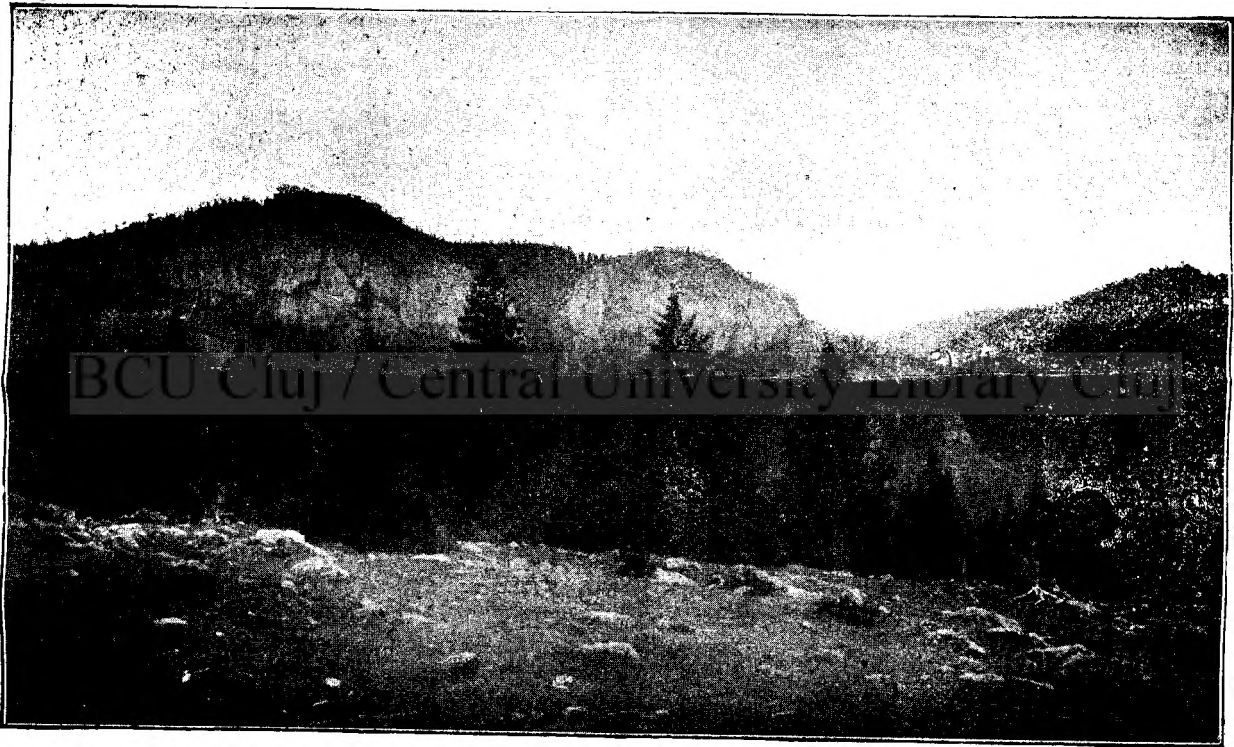
PIETRA ALBĂ, LA MUNTELE VLĂDESA.

La an. 1366. Ludovic regele Ungariei a fost in Bistrița in Ardeal. O c er tă de posesiune pentru o pădure pe munte și c er tă de otar între Românii din Săm Petru de lângă Bistrița și între sașii din satul Noul s'au judecat la apriata dorință a regelui și pe baza unei împăcaciuni in Bistrița in ziua a șeptea a serbătorii trupului lui Cristos (Frohleichnam) 1366 s'a compus un document in limba latină. Din acest document voiu comunica in traducere unele părți și partea, ce are să servescă de dovadă și in limba latină.