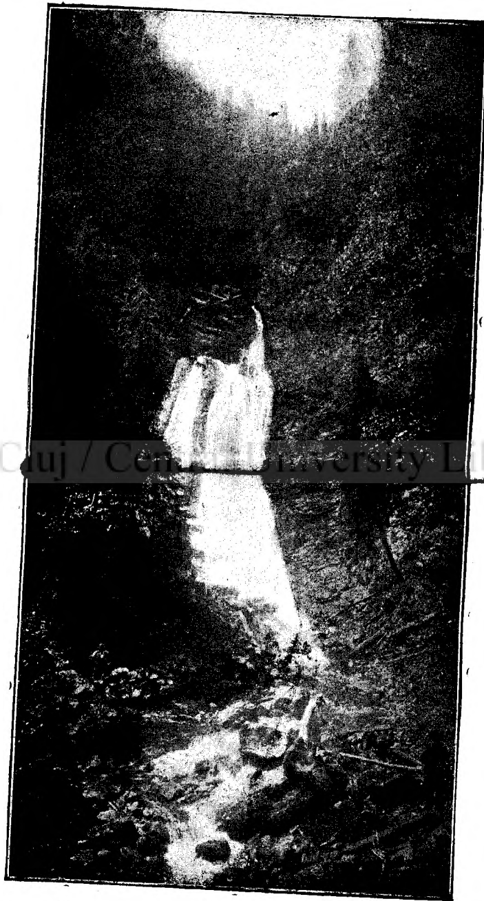
CATARACTA DELA RECHIȚELE LA VLĂDEȘA.

Și me desbăteam!... De-odată pe când căută să me fărîscă fără voința mea, simt ceva că me trăgea