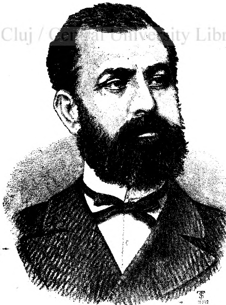
P. S. AURELIAN.

Din câte se știu — scripte séu tradițiuni — nici in Téra Muntenescă nici in Moldova idea de teatru nu pėtrunsesse până pe la 1812. — Geamala, (după povestirea ce mi-a făcut principele Ion Ghica, un fel de momie imbrăcată femeesce, cu un cap mare, avénd doue obraze de gém séu de oglindă, cu trupul făcut din cercuri de butie, un fel de imens malacof lipit cu hârtie, cu pânză roșie și cu tot felul de loloațe de cãrpă colorată, de cordele și de pěr de cal; avea cămasă cu altițe, fotă, șorț, bete cusute cu fluturi