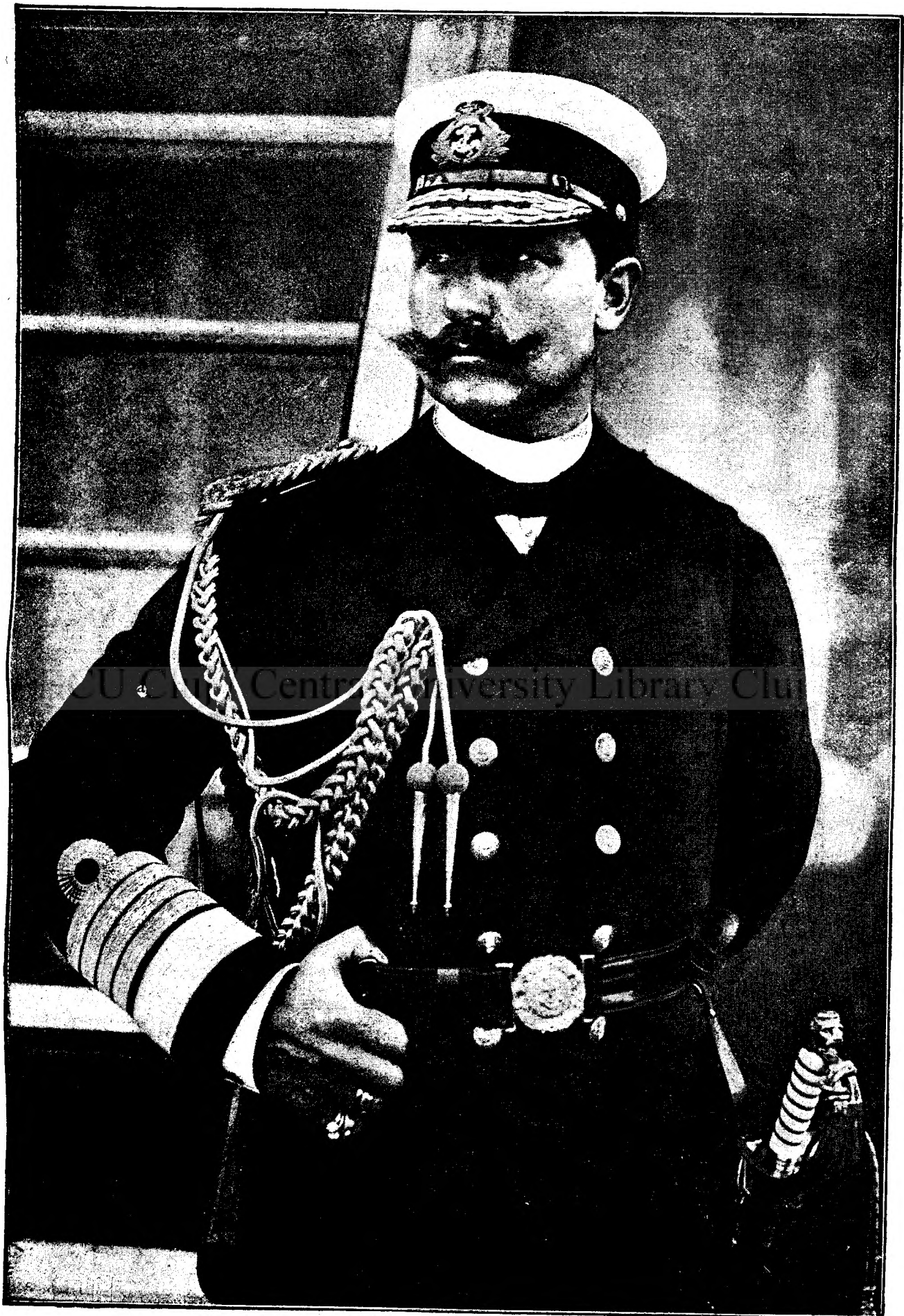
Vilhelm II, împăratul Germaniei.