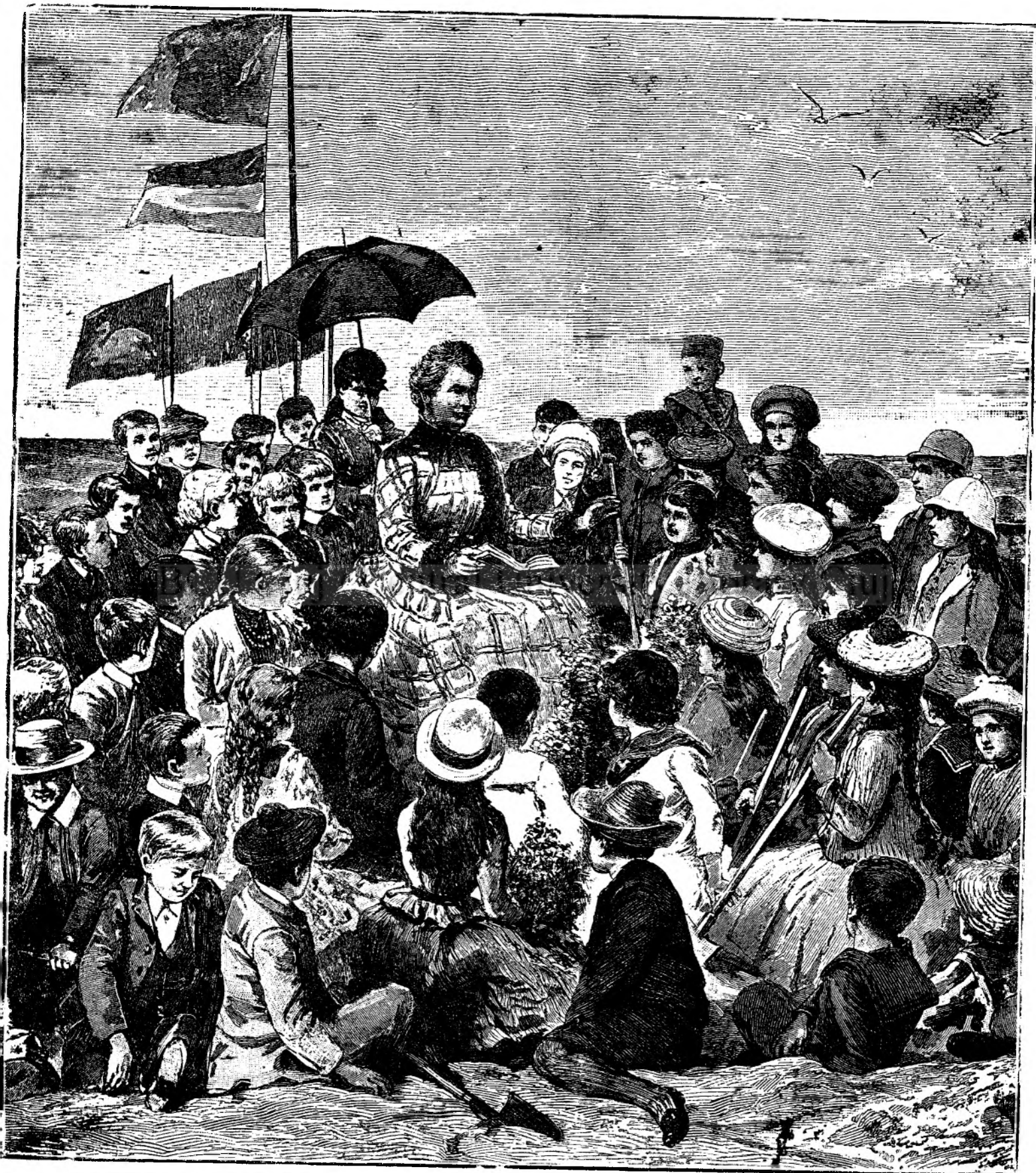
Carmen Sylva între copii.