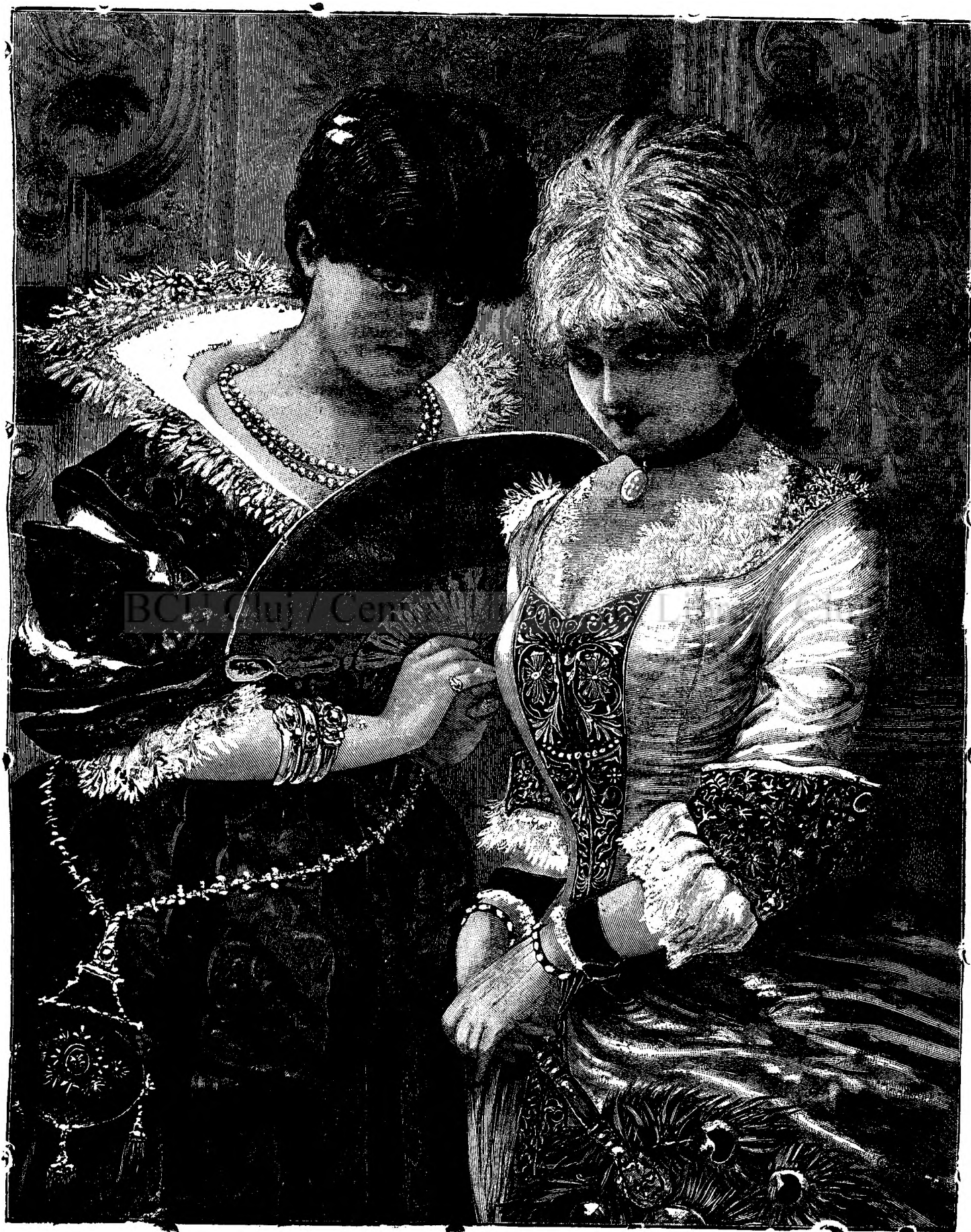
Care-i mai frumoasă?