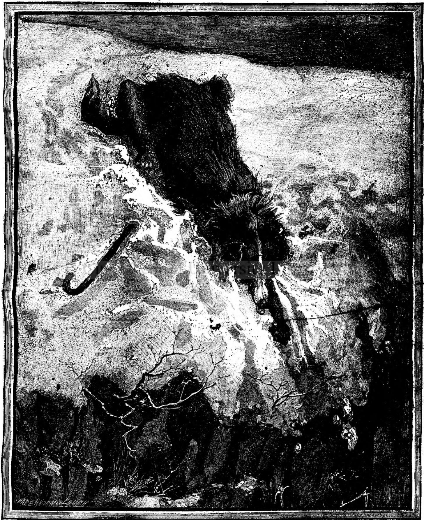
CÂNELE DIN MUNTELE ST. BERNARD.