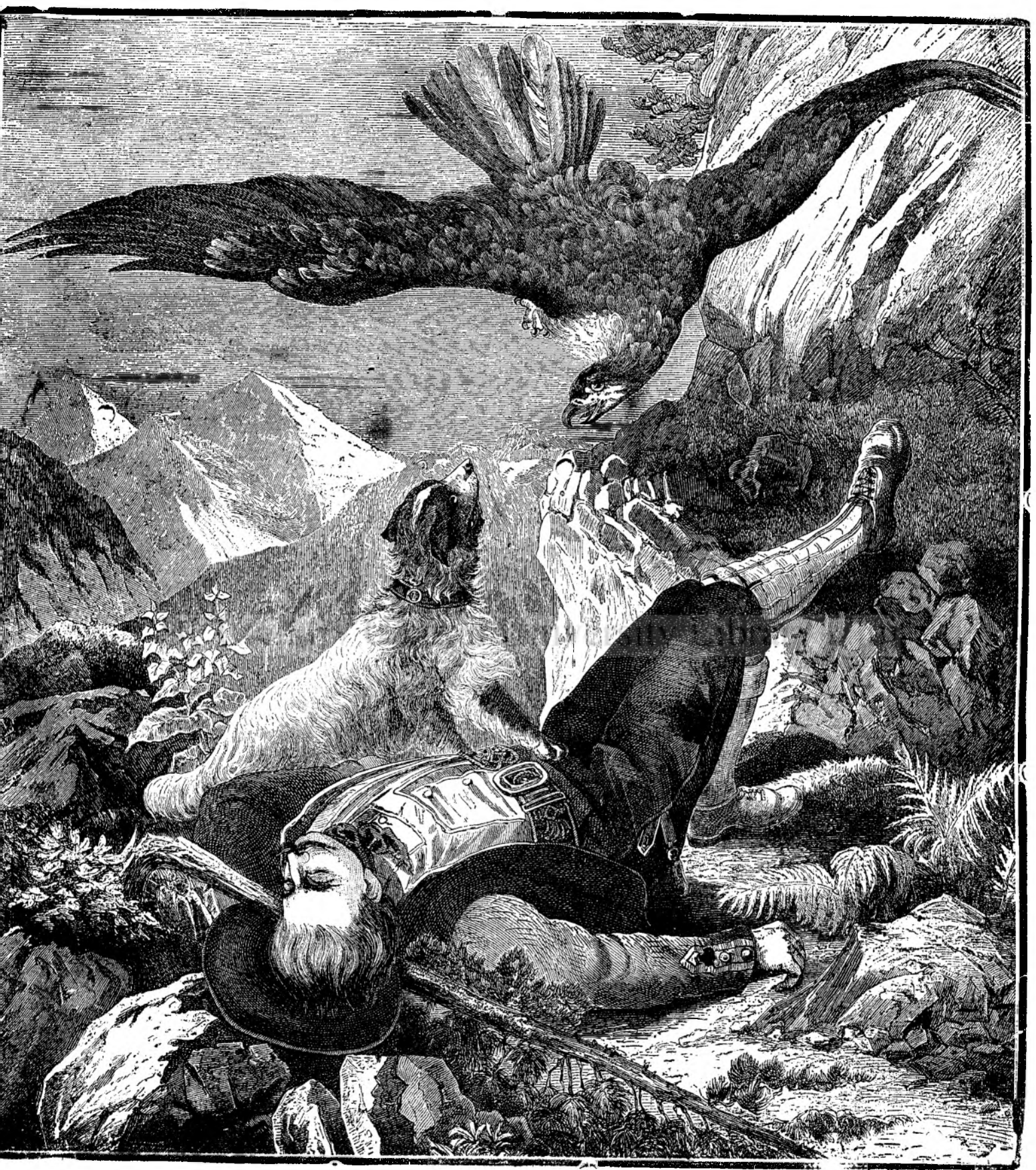
C Â N E L E F I D E L .