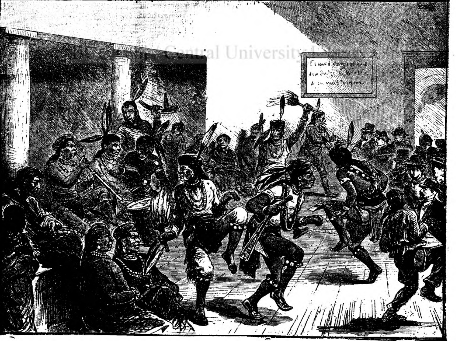
TIPURI DIN INDIA.