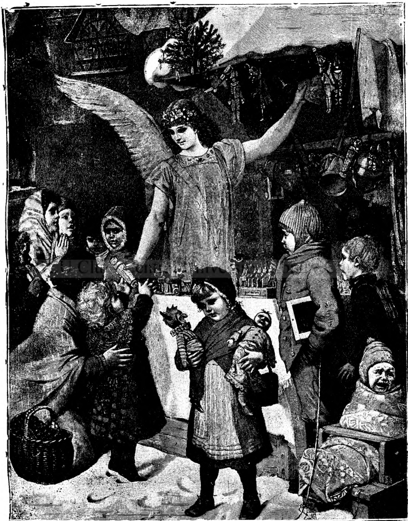
IN AJUNUL CRĂCIUNULUI.