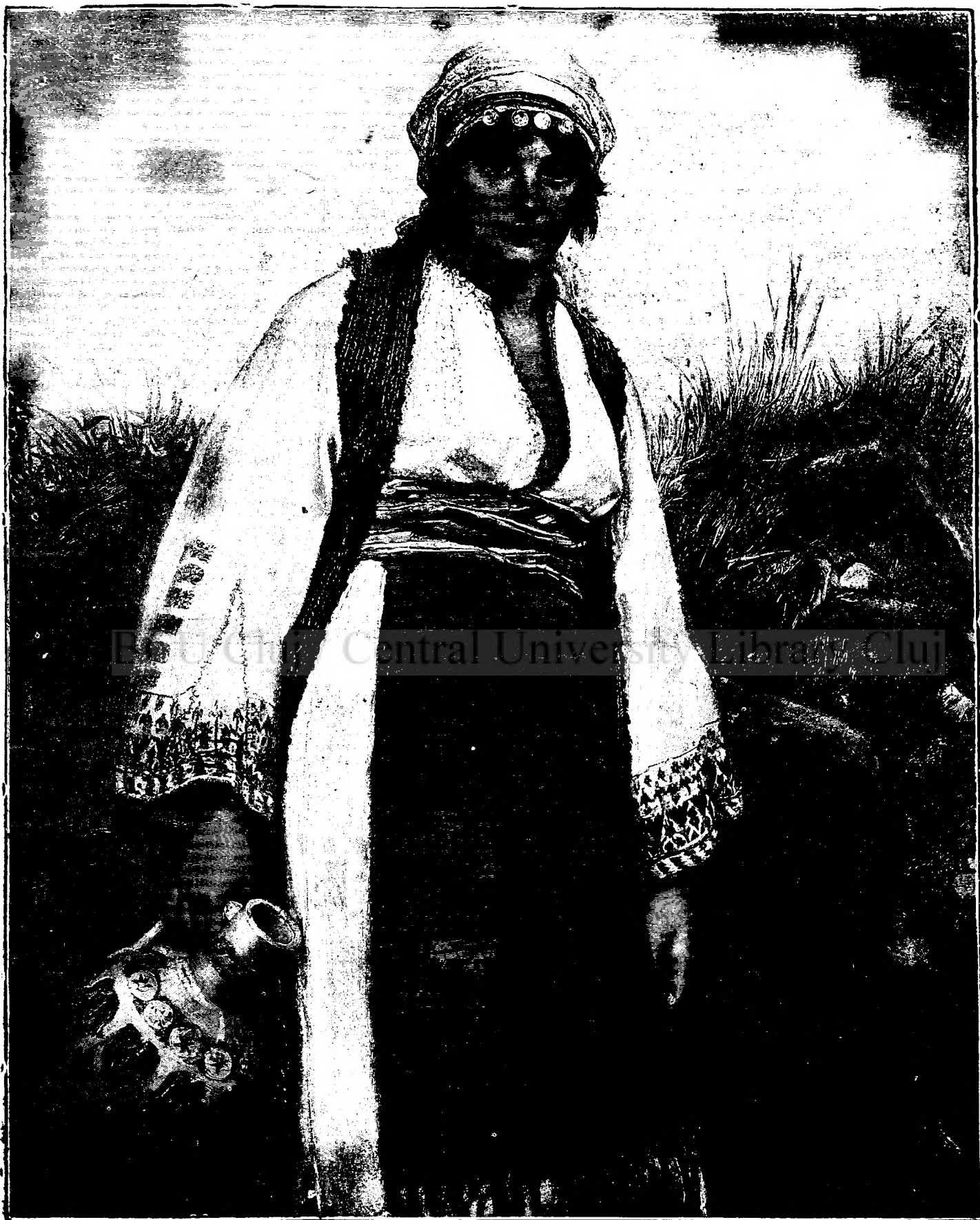
BULGARĂ DELA DUNĂRE.