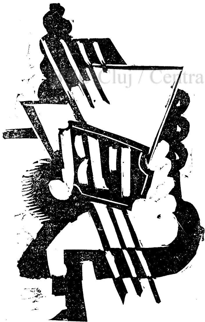
Linoleum de Marcel Iancu

Scarlat Callimachi, Marcel Iancu, Ion Vinea, directeurs du CONTIMPORANUL et du PUNCT désirant unir leurs forces de propagande afin de mieux soutenir l'effort moderne en Roumanie, ont décidé la fusion des deux revues en une seule sous le nom de CONTIMPORANUL, qui paraîtra augmenté, une fois par mois et se vendra au prix de 3 lei.