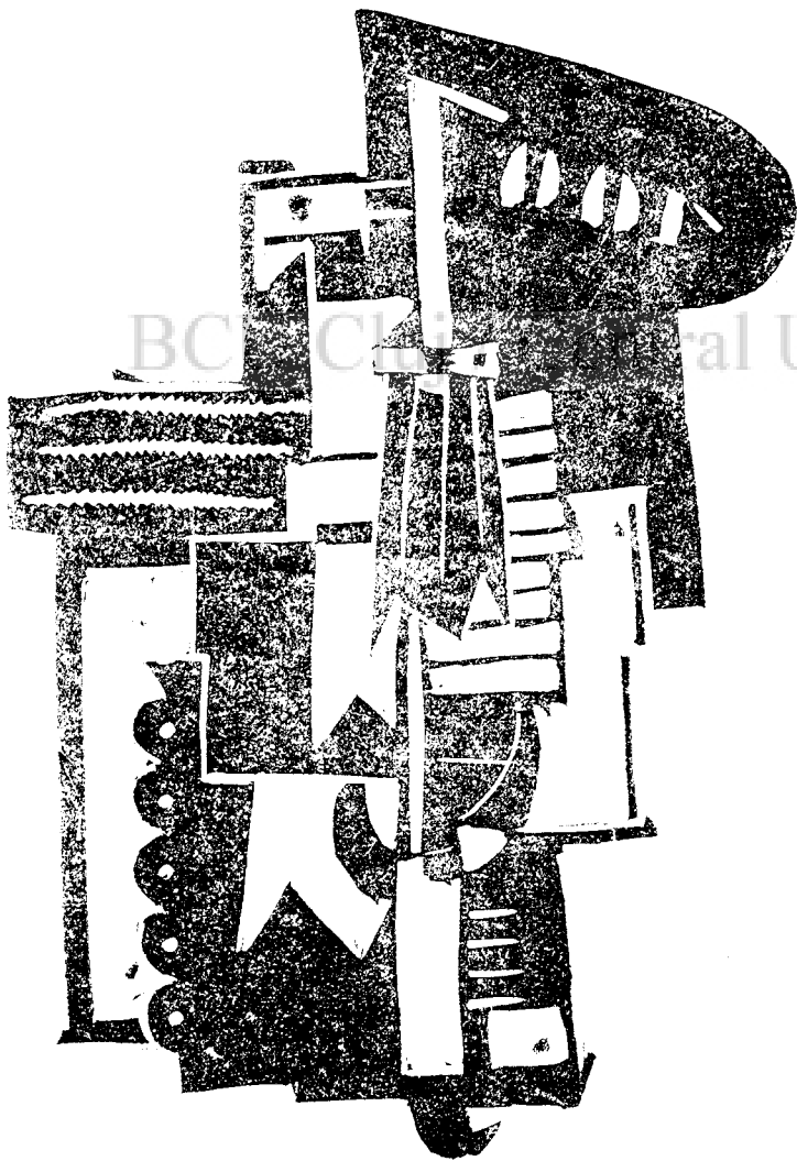
Linoleum de Marcel Iancu