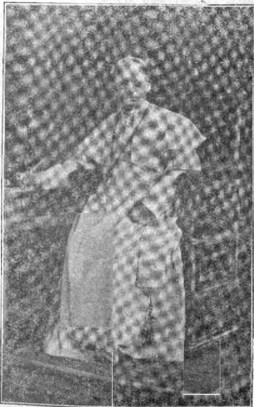
† Papa Pius al XI-lea