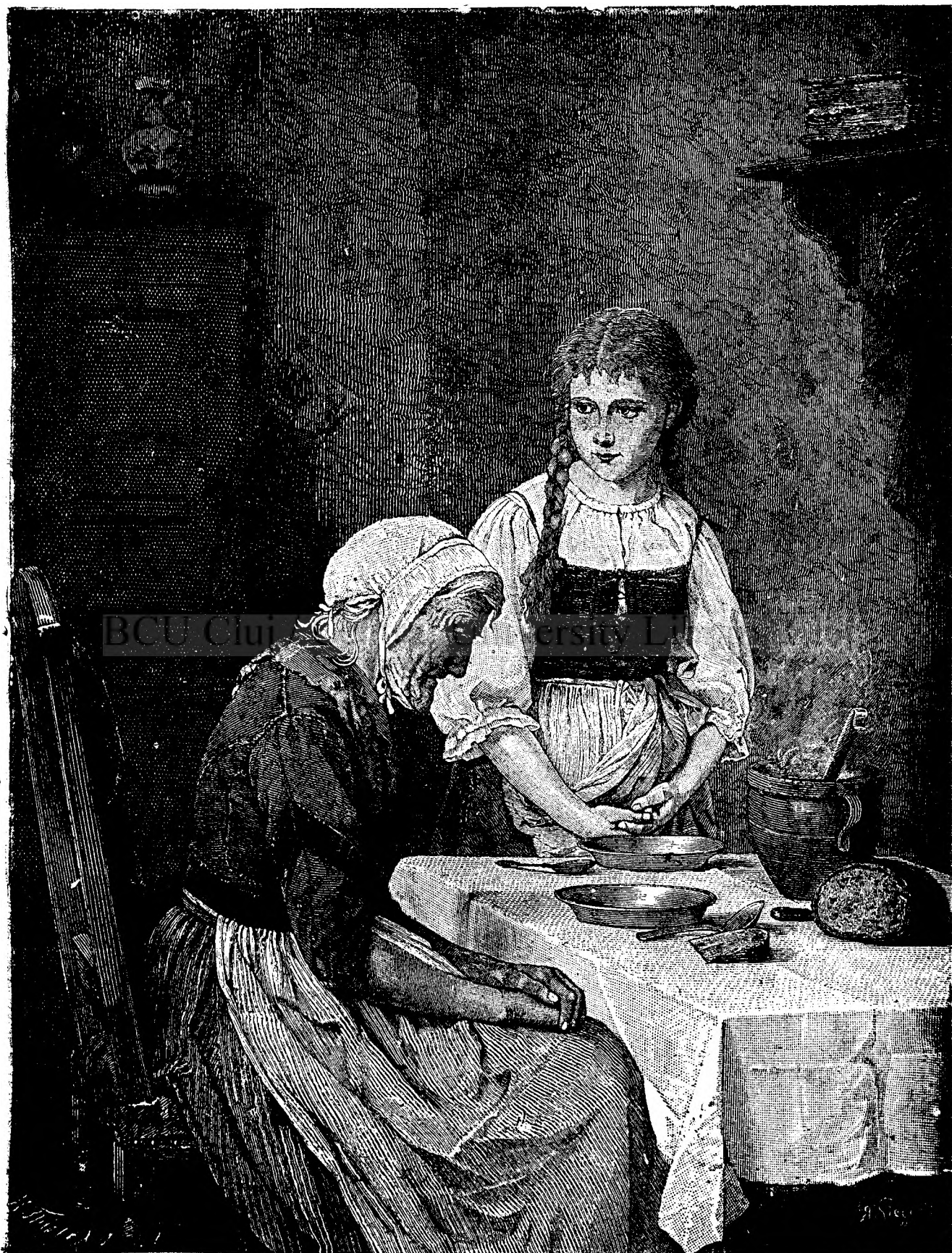
PÂNEA NOSTRĂ DE TÔTE ÎILELE DĂ-NI-O NOUE ASTĂDI!