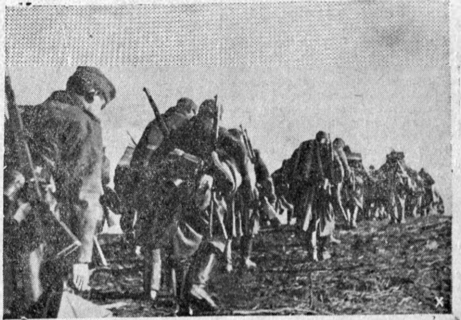
Undeva pe frontul răsăritean, după lupte crâncene soldații pornesc în marșuri lungi și obositoare, în urmărire a dușmanului care se retrage.

30 milioane lei pentru un ta- blou. Printre alte obiecte vândute la licitație la Haga, se afla și un tablou de marele pictor german Rembrandt, care este considerat ca unul din primele sale lucrări istorice. Tabloul care poartă tit- lul „Bunătatea împăratului Titus” a atras privirea multora. Prețul de strigare a fost de 50.000 gul- deni, care însă a fost ridicat în timpul licitației la 300.000 gul- deni, ceace face cam 30 mili- oane lei. Pentru această licitație a fost nevoie de numai 4 minute. Cumpărătorul este un negustor de artă.