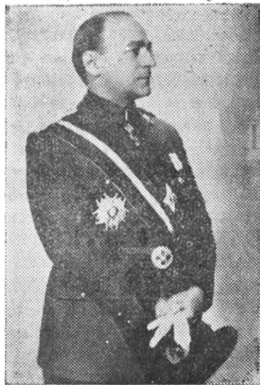
Dl ministru Armand Călinescu

Noul guvern este întâiul guvern al „Frontului Renașterii Naționale”. În el au intrat tot oameni valoroși, de muncă și pricepere ai țării. Trebuie amintită mai ales numirea dlui Armand Călinescu ca vice-președinte al consiliului de miniștri, Dsa, care este cunoscut ca un om hotărît și de muncă, va putea înlocui astfel pe I. P. S. Patriarh, la conducere, când acesta va fi împlădit, asigurând ordinea și liniștea în țară. Din noul guvern fac parte șase ardeleni, ceea ce înseamnă că se încearcă în această guvernare, să se ajungă la o deplină unire sufletească a Românilor din toate provinciile.