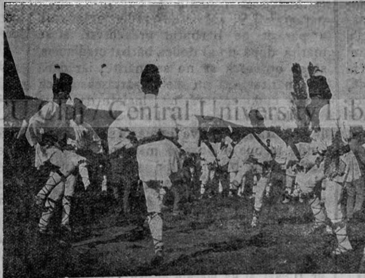
Călușeri jucând la serbările „Astrei“

Toată această mulțime am văzut-o defilând prin fața conducătorilor. Aveai impresia, privindu-o, de o siguranță neșovăelnică, de puteri ce nu pot fi înfrânte, cari vor fi la nevoie stâlp al Patriei.