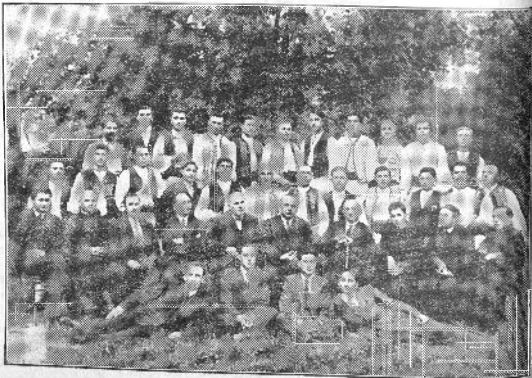
La sfârșitul cursurilor Școlii Țărănești care a funcționat la Blaj anul trecut, profesorii Școlii s'au fotografiat cu cursiștii împreună, așa dupăcum ne arată chipul de mai sus. În cele două rânduri de deasupra sunt cursiștii, iar în cele două de din jos sunt profesorii și conducătorii Desp. Blaj al „Astrei”.