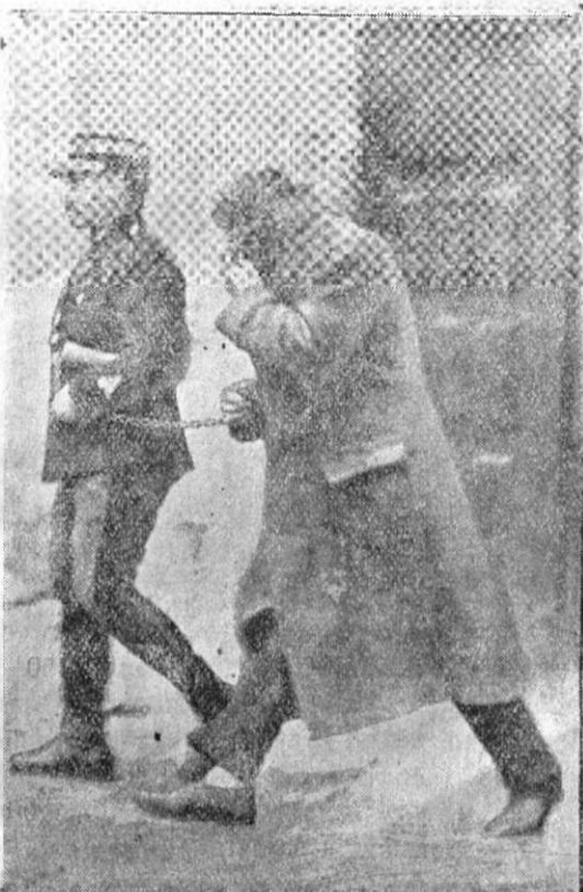
Chipul acesta arată pe unul dintre tovarășii escrocului Stavisky, prins de poliție.