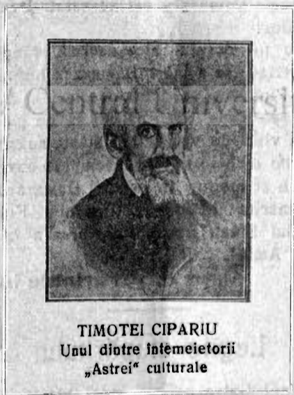
TIMOTEI CIPARIU Unul dintre întemeietorii „Astrei“ culturale

aceeași oblăduire, dar simțământul românesc nu trebuie totuși să adoarmă niciodată, cât timp vor mai răsuna prin vălele Carpaților graiurile strănepoșilor lui Traian. În frământările vieții de toate zilele avem atâtea coticuri cari ne despart și ne învrăjesc, atâtea dureri și nemulțumiri între frate și frate, cari ne înveninează. La „Astra“ ne putem desface de toate și inimile pot să ne bată împreună.