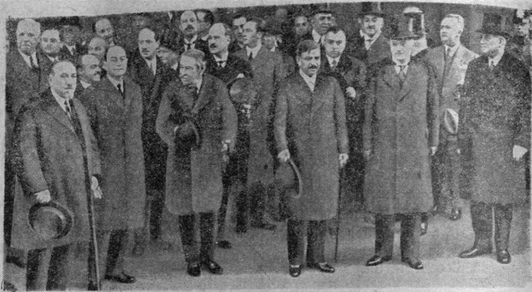
Cel de al doilea din stânga dl Curtrus, apoi mai departe, tot din stânga spre dreapta, dnii Briand, Laval și Brüning; la dreapta, după Briand: dl Poncet.