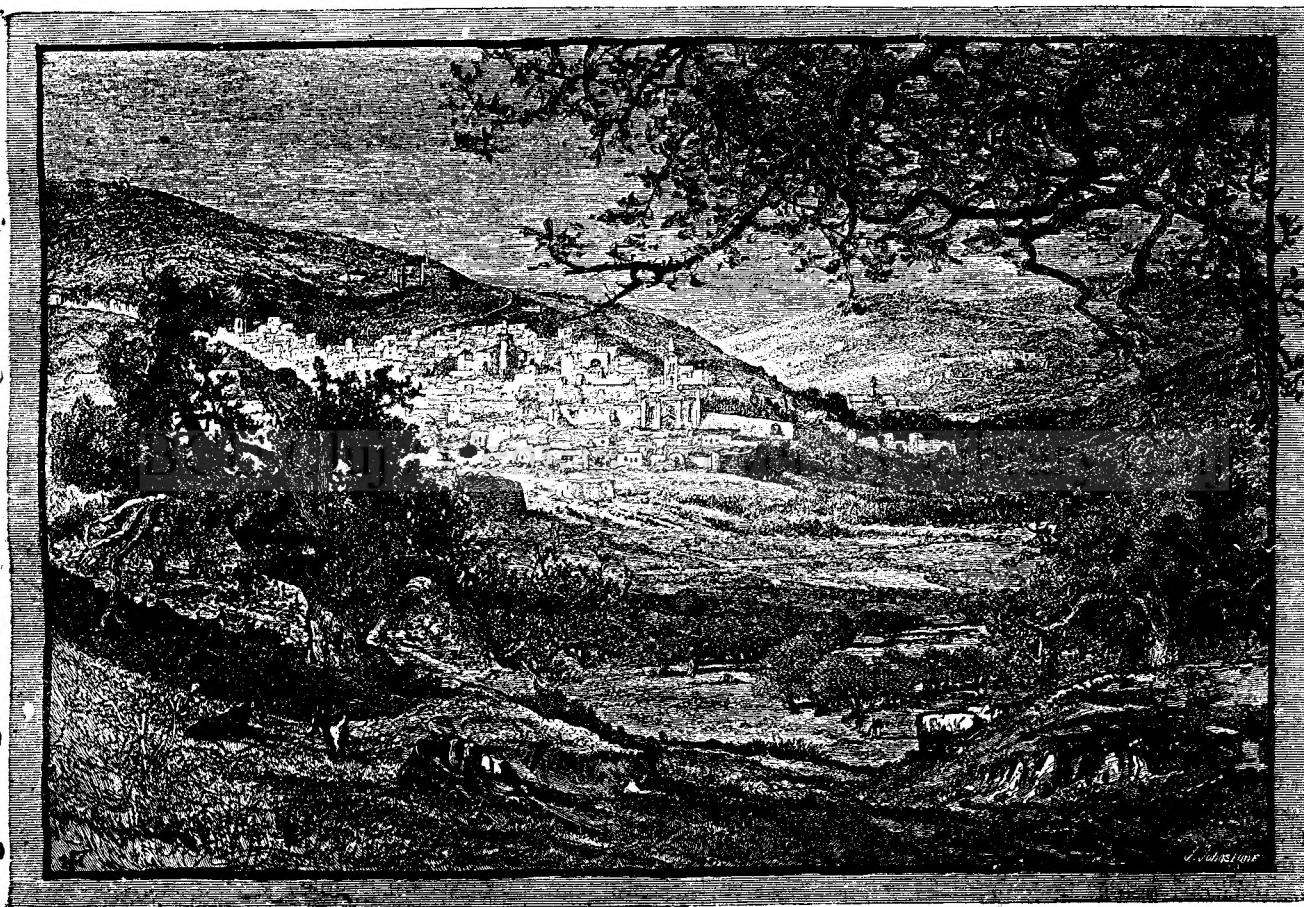
Nazareth de cătră mięqăđi.

Solean eră din numărul ōmenilor cu noroc. Trăise până aci fără să considere pe femei de cât ca un