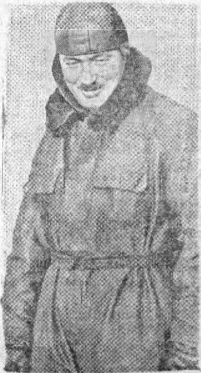
Sburătorul acesta este francezul Bossou-trot, care a sburat 5000 de kilometri într'una, fără de a se coborî de pe aeroplanul său.