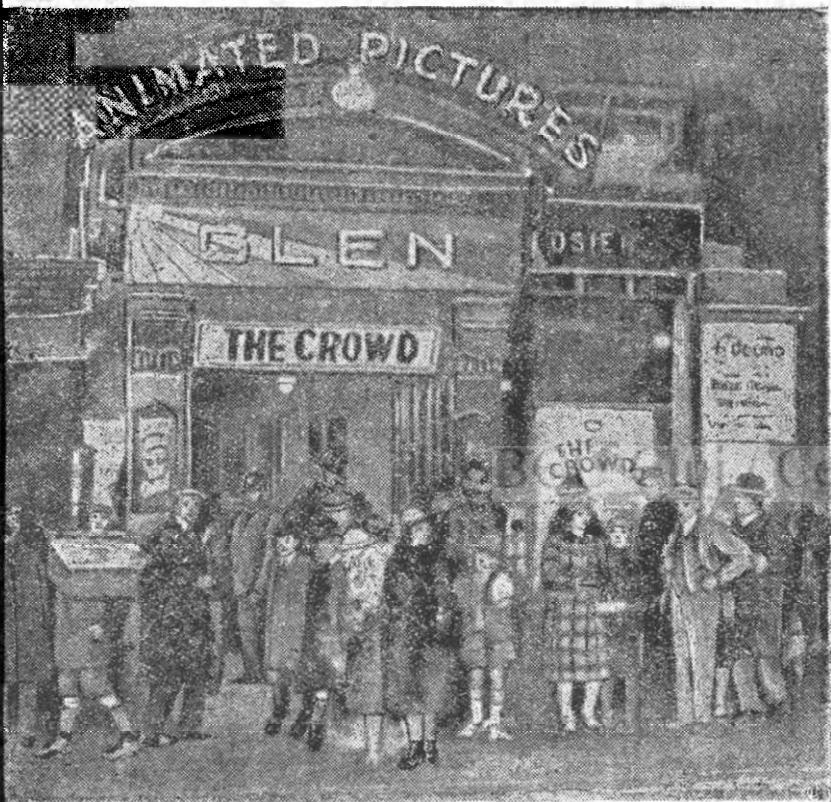
Intrarea în cinematograful cu pricina. Chipul trimis din Anglia, prin telegrafie.

Mare este mirarea și suspect e cazul, că atâtea jafuri după o altă, ziua și noaptea și încă