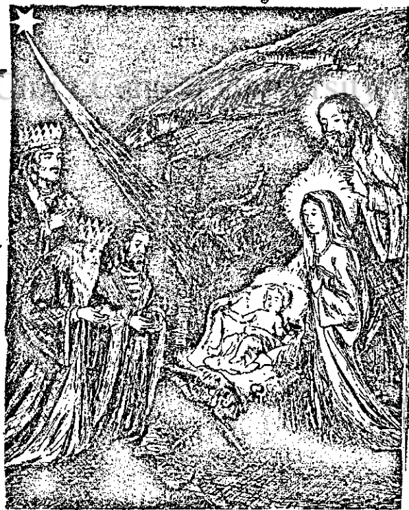
Magii la ieslea din Villaim

să între la inimile tuturor, bogați și săraci de-o potrivă, și va ști afla calea care va duce această țară la pace și mulțumire.