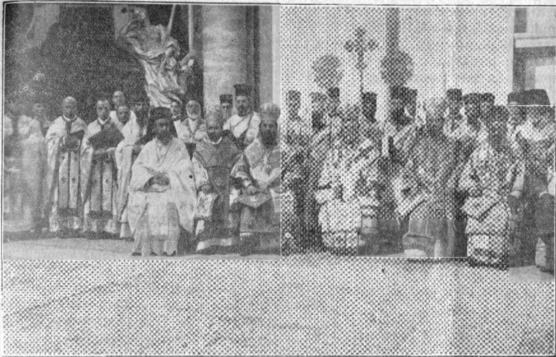
Un chip frumos din calendarul dela Blaj pe 1927.

Asămănându-și în cele de mai înainte viața cu cursa pe carea o făceau atleții în circurile romane și dintre cari învingătorul, ajungând cel dintâi la țintă, primea drept răsplată o cunună, — sfântul Pavel continuă această frumoasă pildă sau icoană, și spune că el este sigur că va primi această cunună a biruinței dar totdeauna și a dreptății, pe carea însă nu-i vor da-o judecătorii pământenii, ca în circurile romane, ci însuși Domnul nostru Isus Hristos, dreptul judecător, în lumea cealaltă. Sfântul Pavel însă, care întreagă viața