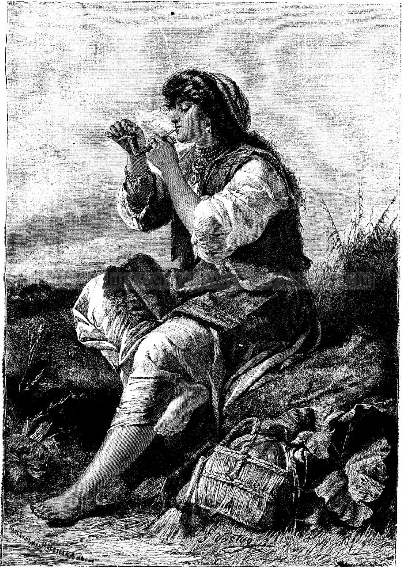
T i g a n c a .