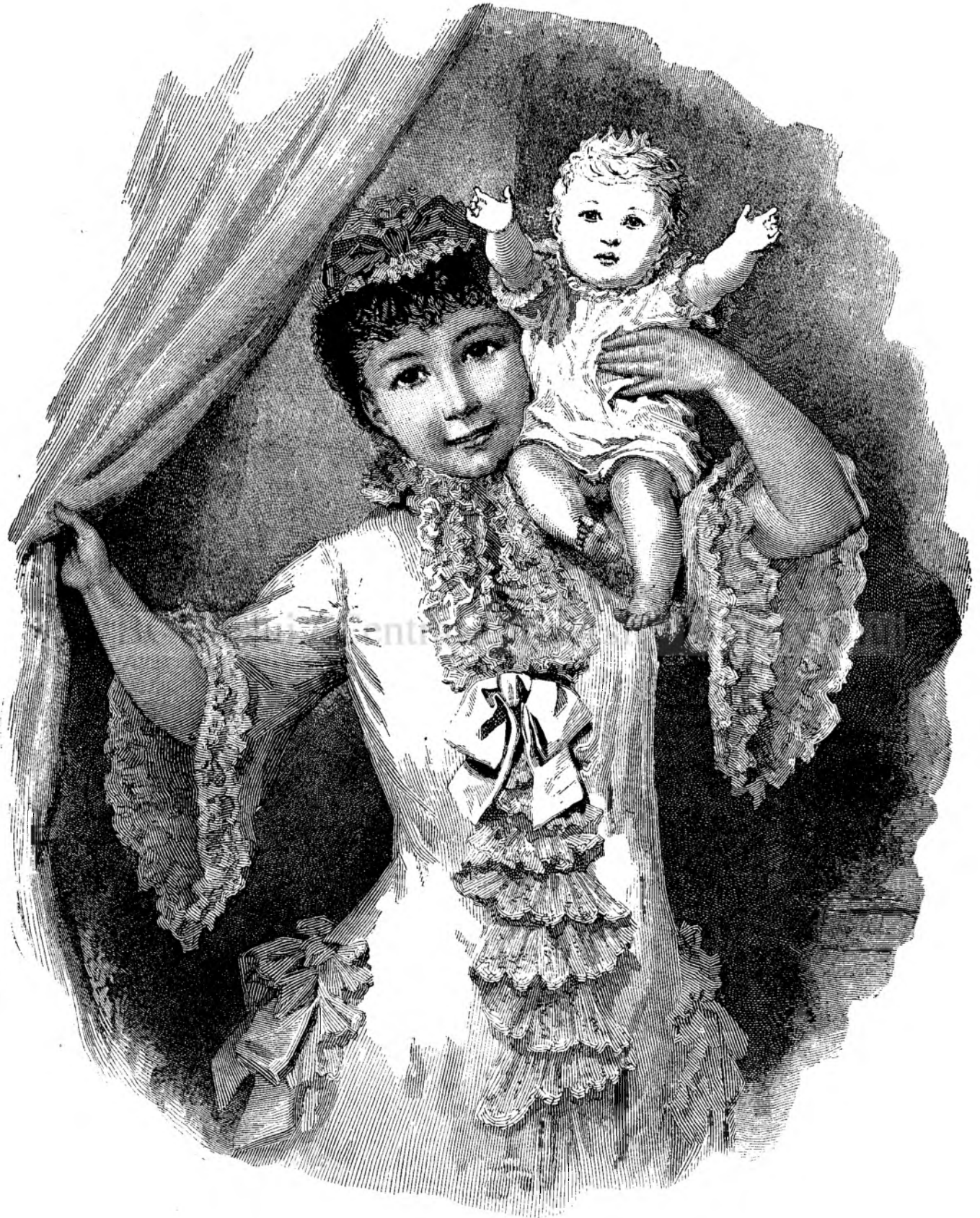
Serbatori fericite !