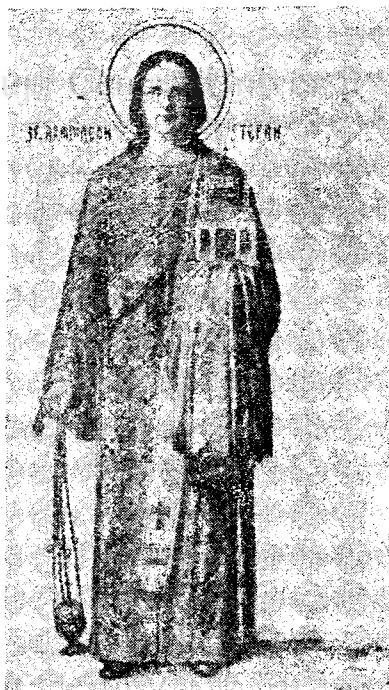
Sfântul Arhidiacon Ștefan

Dacă ne întoarcem cu mintea la primăvara anului 1946,