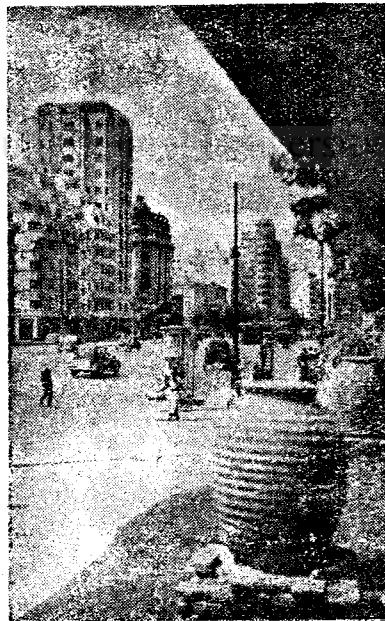
Frumusețea orașelor noastre VEDERE DIN BUCUREȘTI