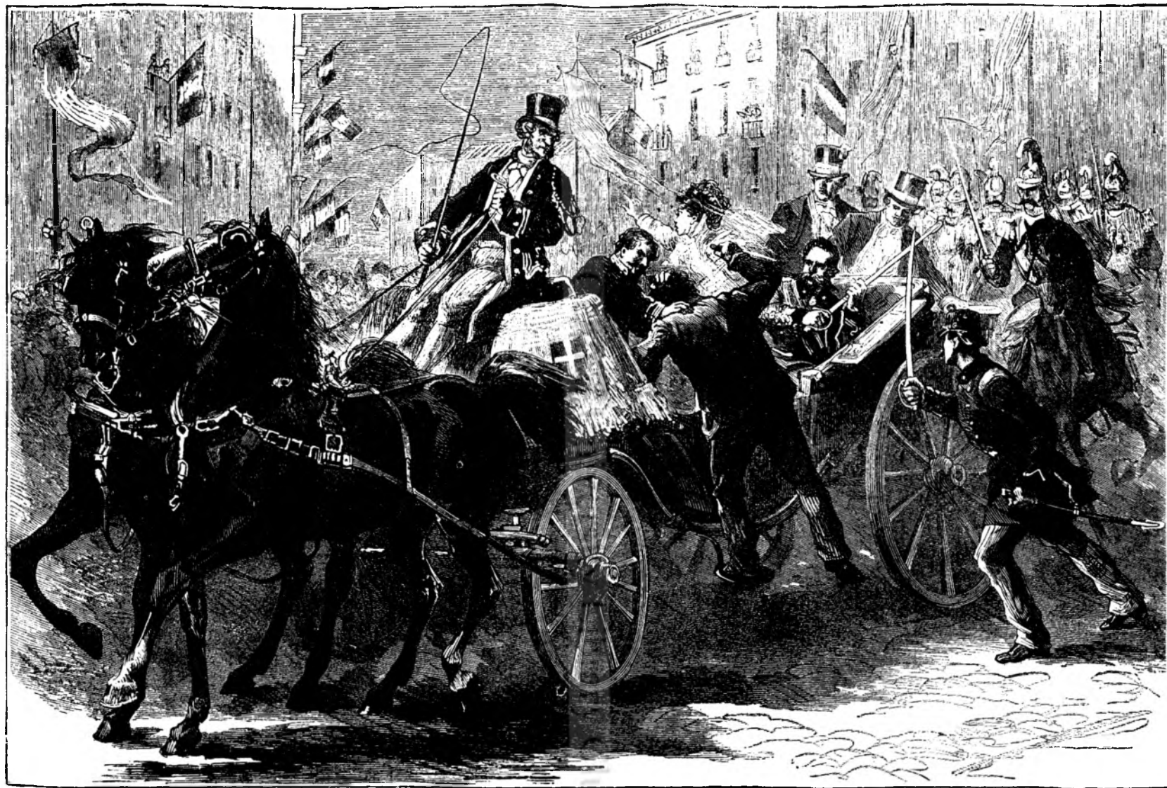
Atentatu în contra regelui Italiei Umberto în Neapolea la 17 nov.