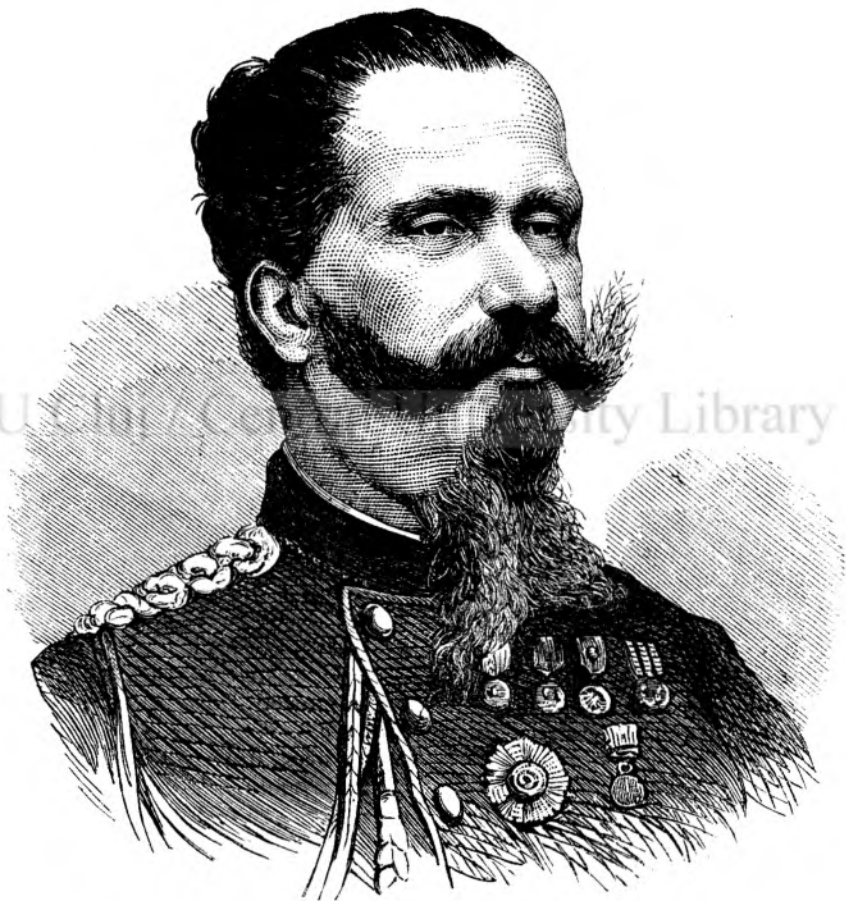
Victor Emanuel, regele Italiei. † 9 jan. 1878.

Ea își puse iute pe capu sialulu de calugaritia, care i ascunse perulu și fruntea, și, precum se îndreptă catra cabinetulu cu grathîi, luă drumulu spre usi'a de esîre.