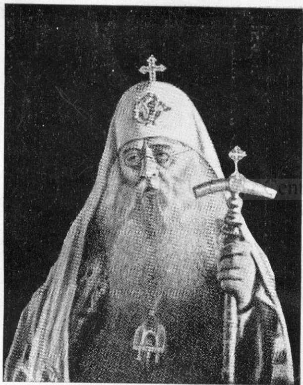
† SERGHIE fost Patriarh al Rusiei