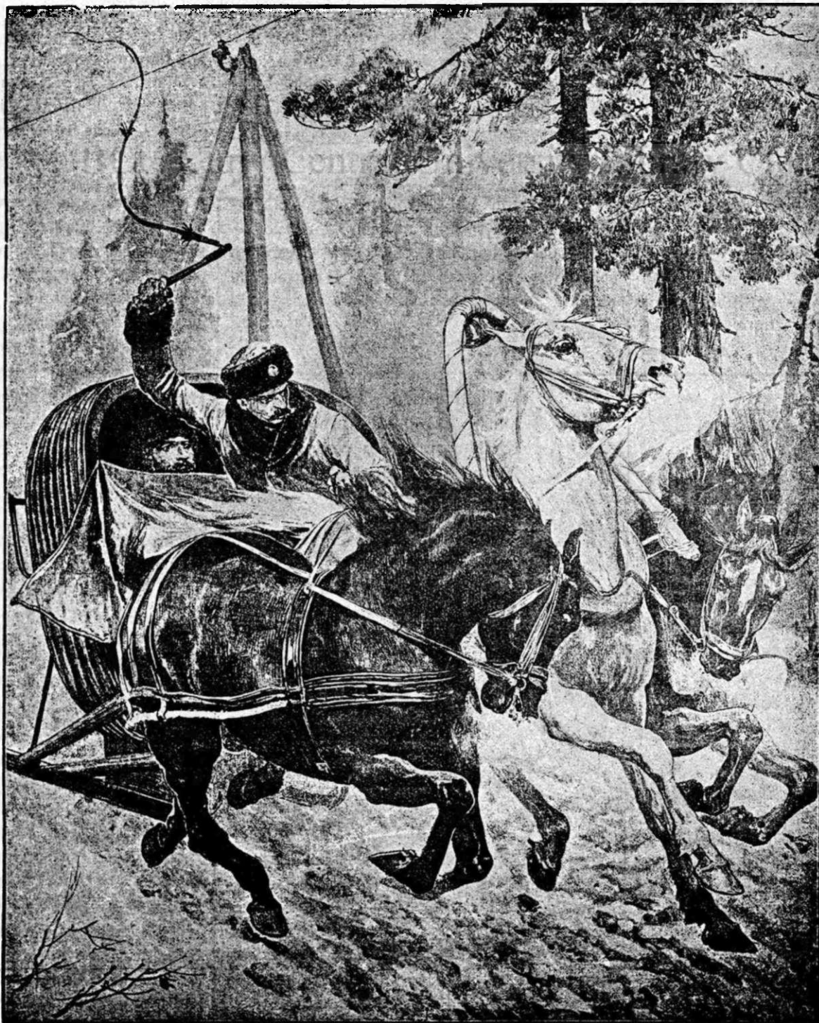
Troica (sanie rusească). (Vezi: „Foița“.)