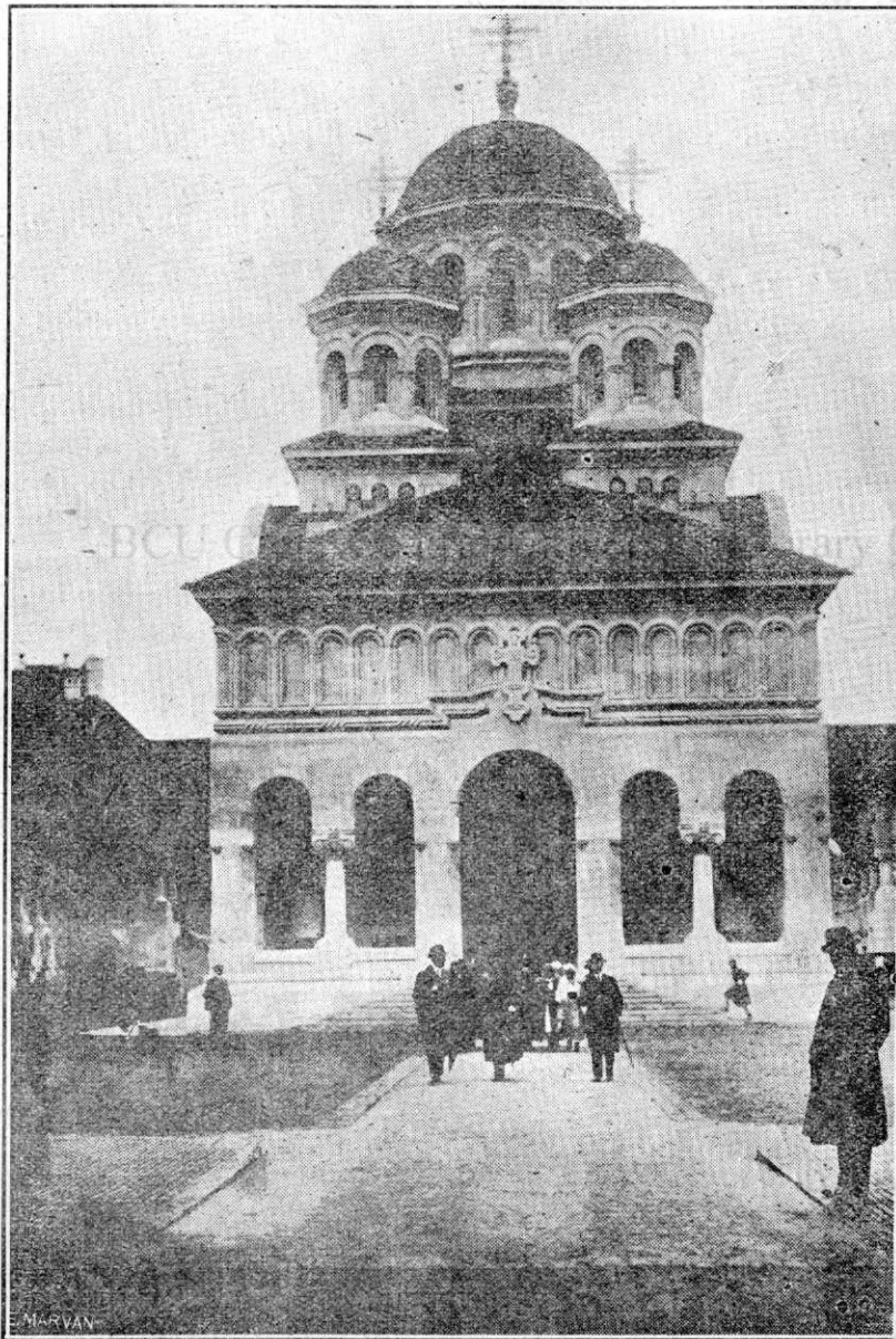
Catedrala „Reîntregirii Bisericii Românești din Ardeal“.

Și că vom lupta, înfrățiți în aceeași credință religioasă, pentru înflorirea scumpei noastre Republici Populare, pentru pace și progres, care sunt atâta de scumpe tuturor oamenilor și atât de plăcute lui