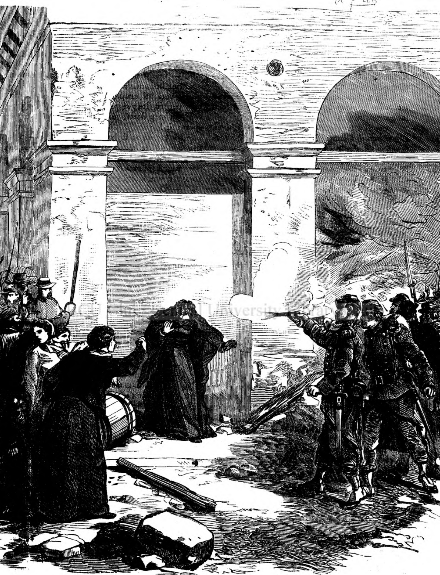
Impuscarea unei femei la Paris, care aprinsese casele cu petrol.