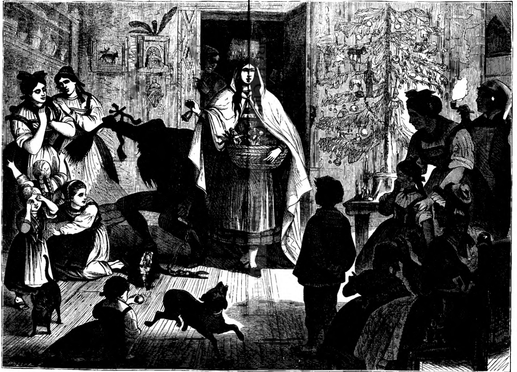
Craciunulu in Alsacia.