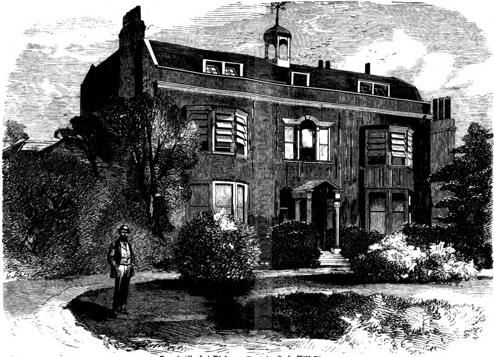
Locuinti'a lui Dickens (Boz) in Gads-Hill-Place.