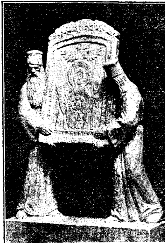
PROCESIUNEA de I. Gheorghe

lea ceva de mîncare, sunt leșinat de tot, de alaltăieri seară n'am pus s'arat pe limbă. După câte știu este om primitor și la urma urmei plătim gros că avem de unde.