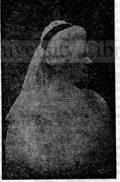
Regele Carol I și Regina Elisabeta