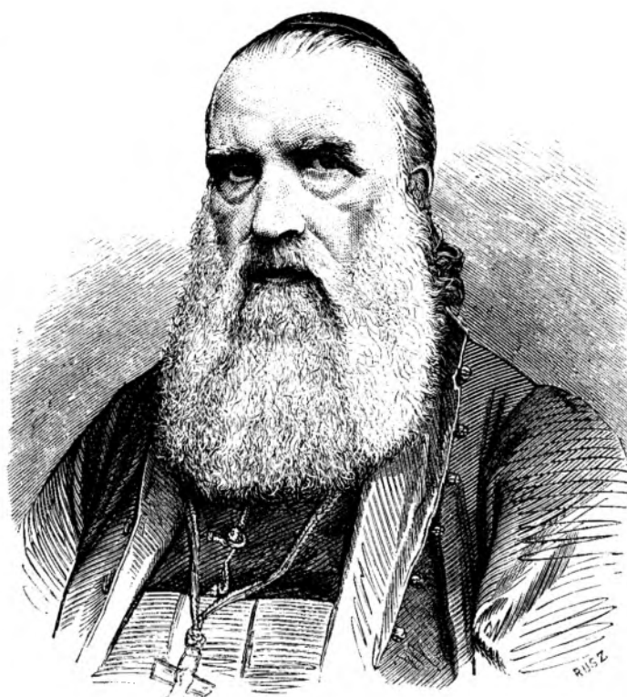
Andreiu Baronu de Siaguna.

Biserice'a gr. resarite'na si intræg'a natiune romana a incinsu dejã fruntea acestei autoritãti stralucite cu cunun'a recunoscintiei, pentru ostenele-i ne bosite si faptele mari, ce le-a facutu spre binele, marirea si bunastarea bisericei si ale natiunei. — Fruptele ostenelelor Sale sunt dejã scrise pe paginile istoriei cu litere nesterse, sunt intiparite pentru totudeuna in animile romanilor din Transilvania Ungaria si Banatu. — Decandu Escelenti'a Sa prin stralucitulu seu talentu a ajunsu la acea trépta, de unde mai evidente pote lucrã si aredicã vócea pentru