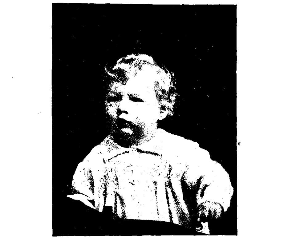
A. S. R. PRINȚUL MOȘTENITOR MIHAI

al datoriei față de țară și de față cu conștiința sa, a hotărât să renunțe la tron și la coroană, în favoarea fiului său, Prințului Moștenitor Mihai. Toți s'au bucurat de această hotărâre, de a primi această coroană la tron.