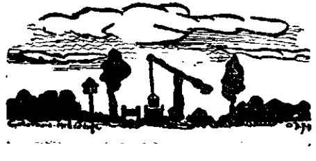
DIN PASUL TURNU-ROȘU.

Această traducere împede nu trebuie să lipsească nici din biblioteca omului de știință, nici din a literaturii și sub nici un motiv, de pe masa omului religioz. N. C. MUNTARG