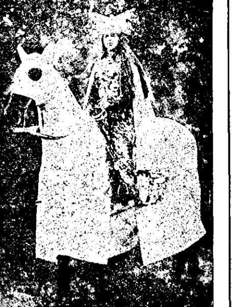
În robul d'n. "Dasmul cu Domnița din vis", jucat în anul 1904. (Atunci A. S. R. Prințesa României)