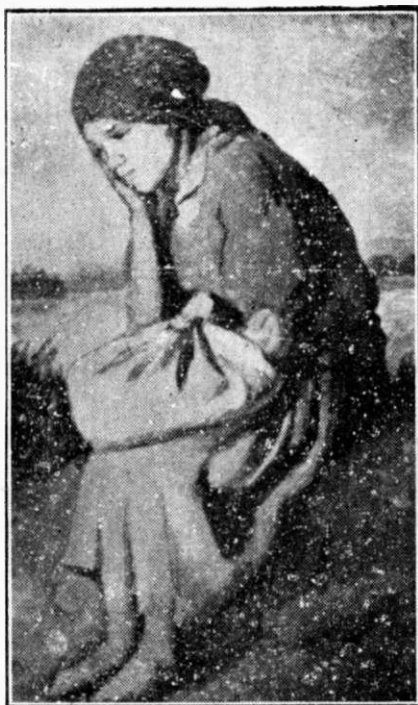
ȘT. TARASOV : IZGONITA