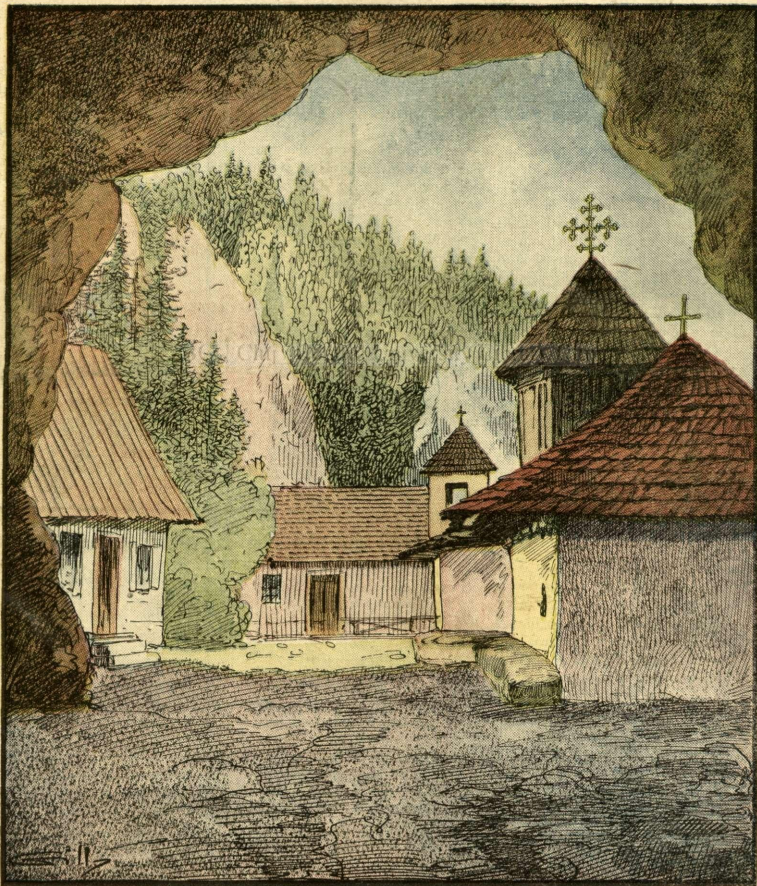
Schitul din gura peșterii Dâmbovicioara