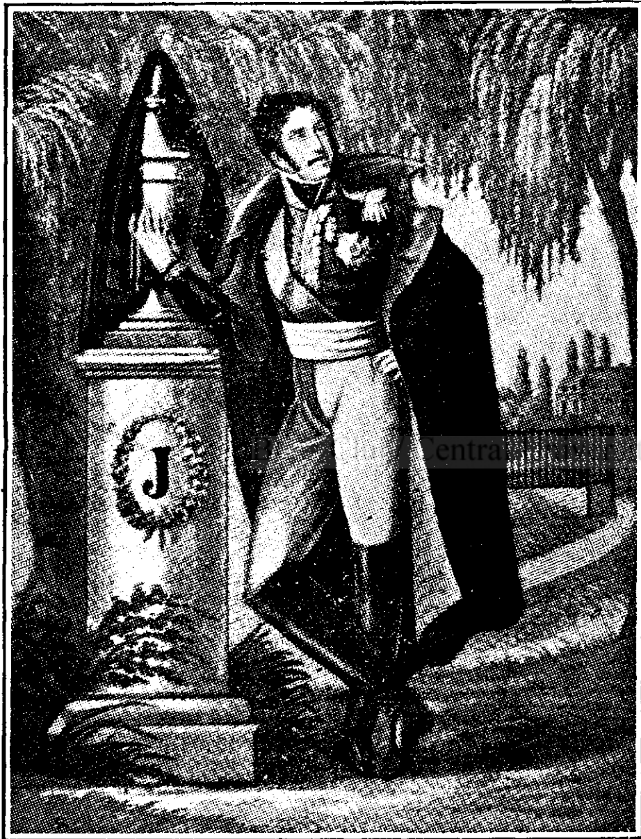
Eugeniu de Beauharnais la mormântul mamei lui.

Am intrat în bibliotecă și am aflat că se catalogau cărțile, de oarece ele urmau să fie vândute peste câteva zile la o licitație publică.