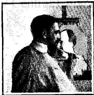
Mașina de sculptat în lucru (faza a 2-a)

Nu de mult s'a descoperit o mașină pentru sculptat și care