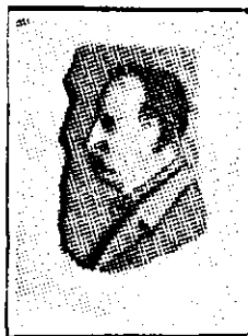
Portret în relief sculptat de mașină

Cu dezvoltarea mașinismului și a artelor tehnice creațiunile artistice făcute de mâna omului vor cădea pe al doilea plan sau vor fi apanajul numai a câtorva care vor putea să'si plătească luxul de a poseda lucrări făcute cu propria mână a geniului creator.