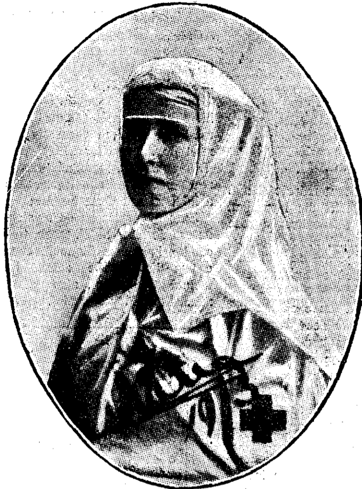
A. S. Regală Prințesa Maria ca soră de caritate