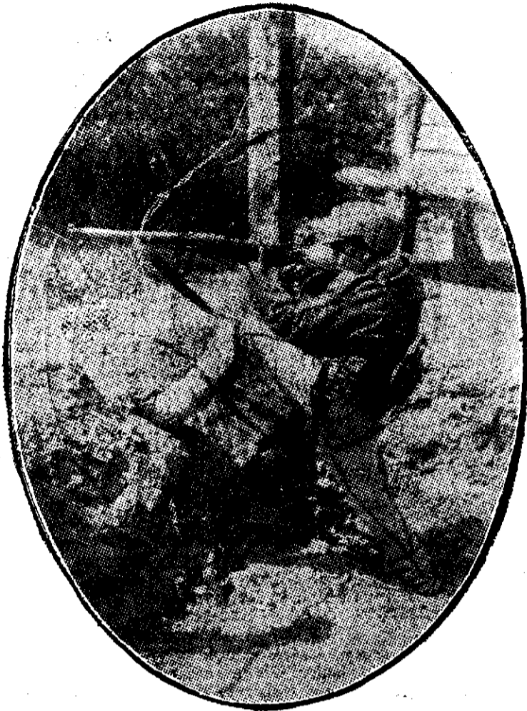
Un soldat sârb în vârstă de 12 ani, în linie de bătaie

ovatkă unde era palatul, peste drum de hanurile lui Gherase, ofițerul mi-a dat ordin ca să las să intre orice acaret ar veni în curtea palatului.