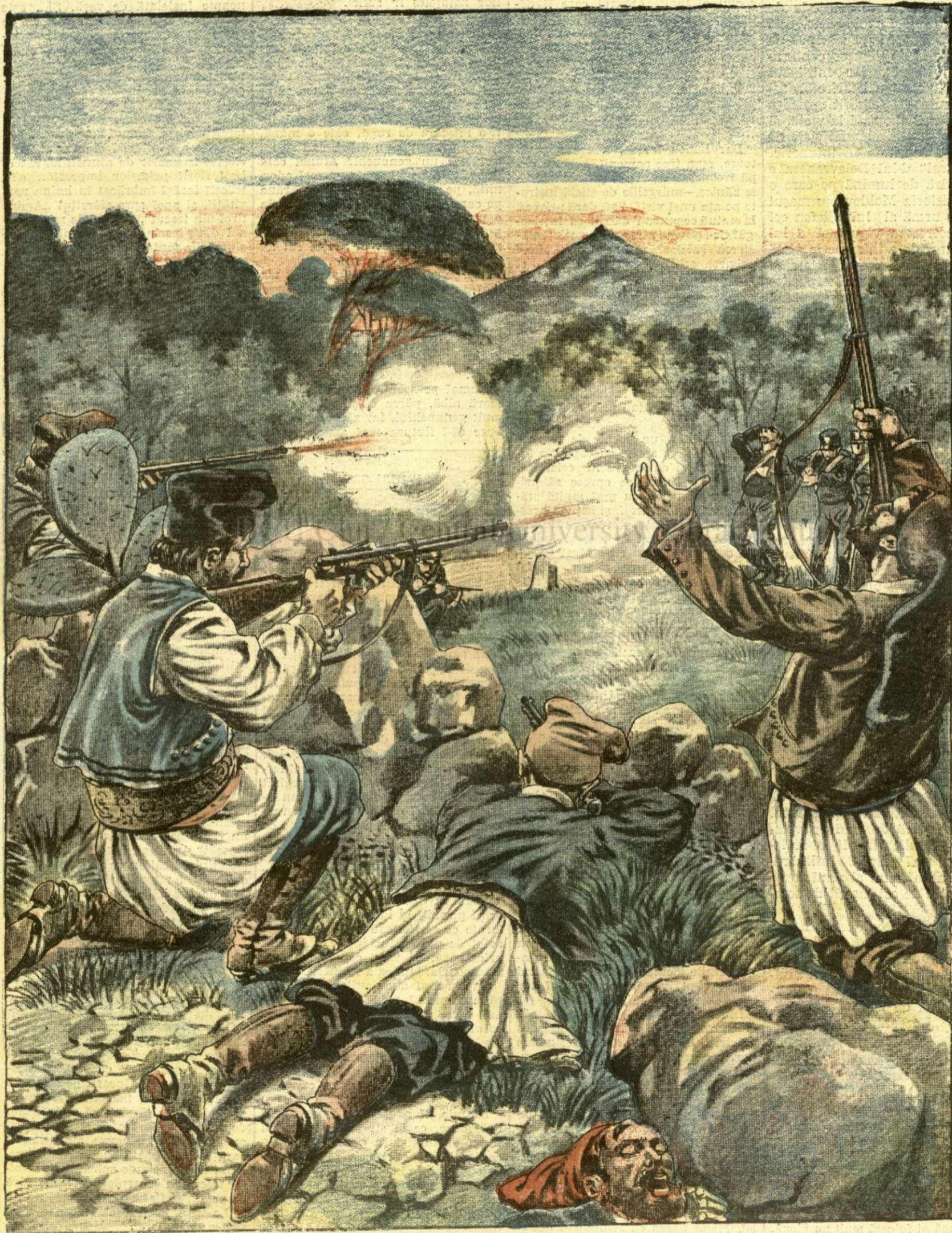
Sângeroasa ciocnire între jandarmi și bandiți în Sardinia (Italia). — Vezi explicații