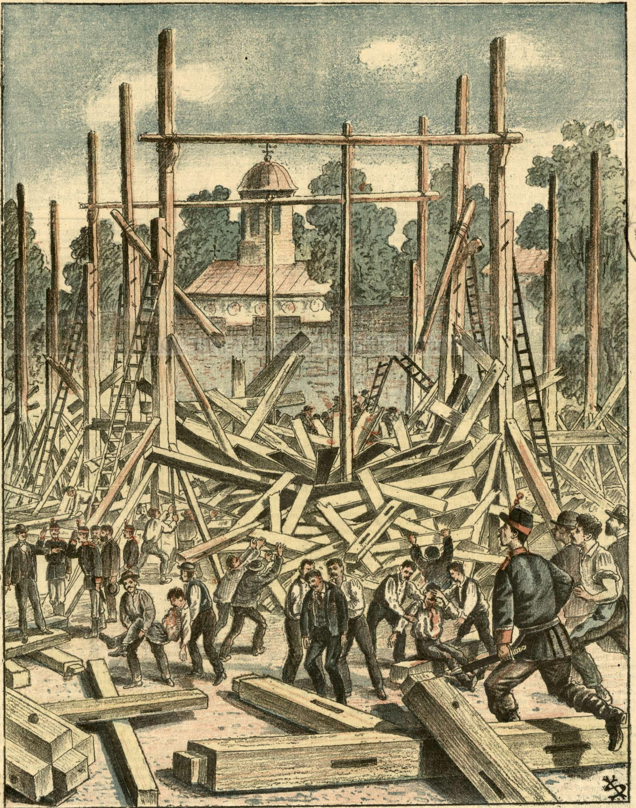
Nenorocirea din grădina Cișmegei. — (Vezi explicația).