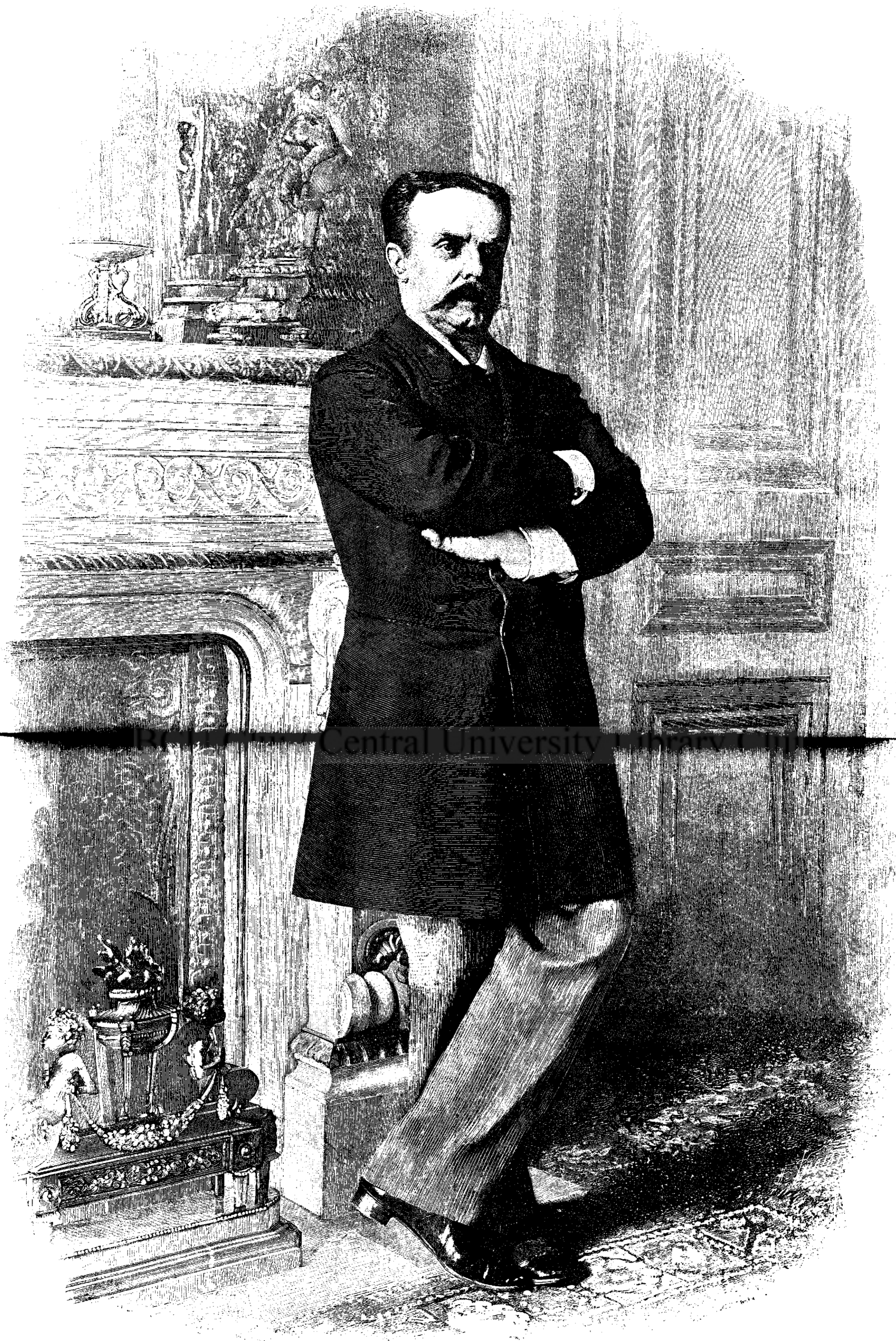
D. CASIMIR PERIER, Președintele Republicei Franceze.