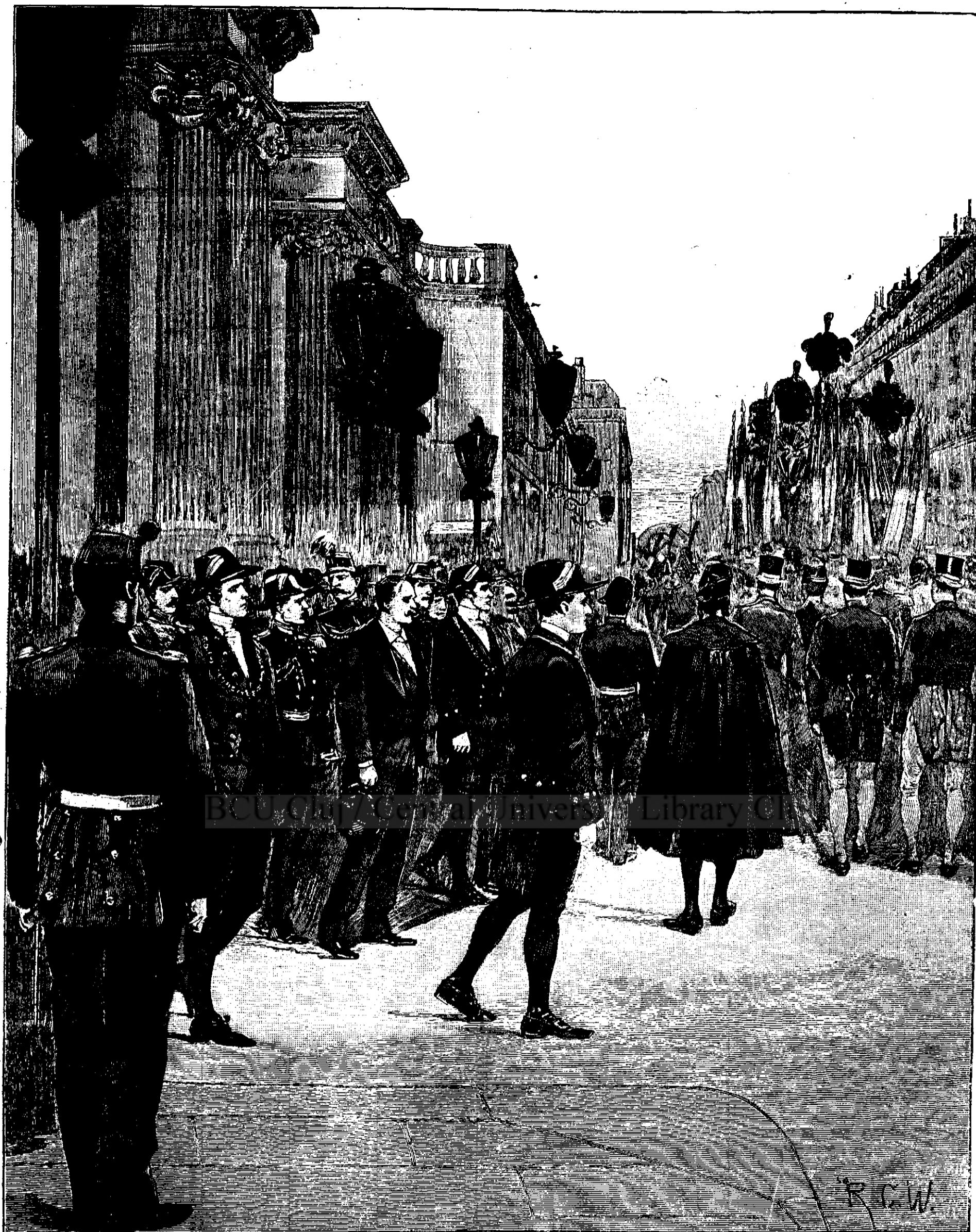
Inmormântarea lui Carnot. — (Vezi explicația).